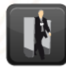
ARCOS DE CONTROL